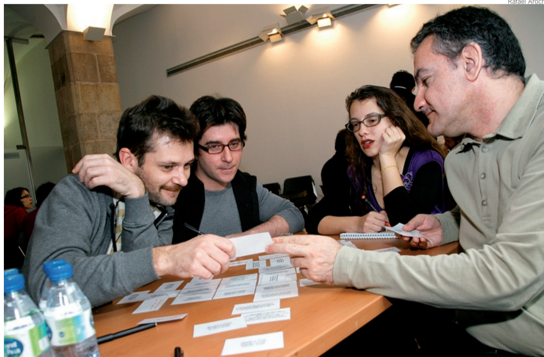
ESTEREOTIPS. Sessió de treball entre artistes i les empreses en la qual es marca la metodologia

A la pràctica, el programa, que s'ha engegat enguany per primera vegada a Catalunya amb els ajuts dels departaments de Cultura i d'Indústria, és una via per buscar parelles d'artistes i empreses que durant un període concret desenvolupin projectes d'investigació. El procés està ben sistematitzat i compta amb una metodologia que ha creat el grup basc Xabide, promotor de la plataforma, a partir de les quatre edicions que té en el seu currículum. Així, la iniciativa